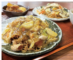
「瀬戸めし2.0」あんかけやきそば

MAP | 裏表紙・D-5 瀬戸市品野町1-126-2 ☎0561-41-3900 🕒 9:00~18:00 (食堂は~15:30/土日祝は~16:30) 📍 年末年始 📍 あり