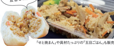
「せと焼まん」や具材たっぷりの「五目ごはん」も販売