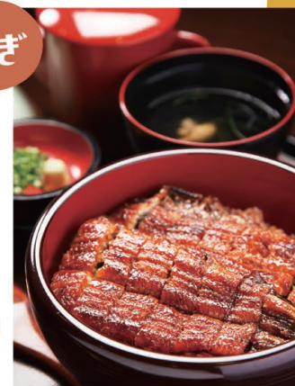
うなぎ1匹分の「ひつまぶし」

ちとせ うなぎ・和食 千登勢 MAP | 裏表紙・C-6 L.O. 20時まで 足をのぼして 瀬戸市東赤重町1-1 ☎0561-82-1555 🕒 11:00~14:00、17:00~L.O.20:00 📍 3月 📍 25台